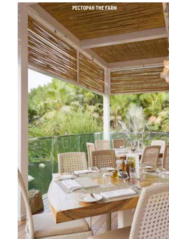
РЕСТОРАН THE FARM