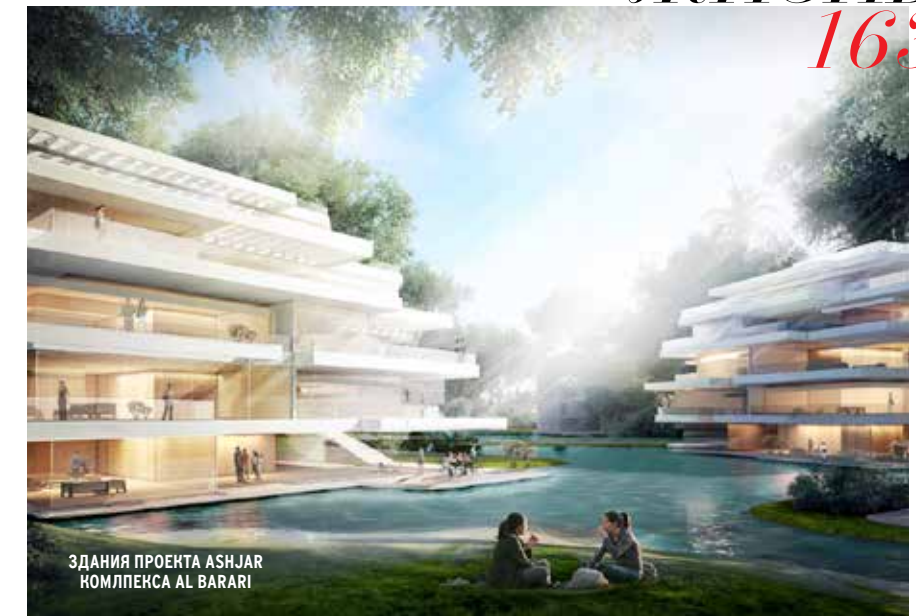
ЗДАНИЯ ПРОЕКТА ASHJAR КОМПЛЕКСА AL BARARI

Ренессанса, Средиземноморский сад, Балинезийский сад, Сад Современности и Водный сад, в которых произрастает 800 видов редких растений, бережно собранных с разных концов земли. Число садов, украшающих этот комплекс достигнет 34 при второй фазе строительства. Продолжая тему единения с природой, здесь также расположен ресторан органической кухни The Farm, философия которого проста – здоровое питание в непринужденной и спокойной обстановке. Здесь можно насладиться блюдами тайской, средиземноморской, ближневосточной и индийской кухни. Достичь еще большего спокойствия можно в центре красоты Heart&Soul, также расположенном в Al Barari. Опытные терапевты спа-центра рады помочь расслабиться, выровнять баланс души и тела и позаботиться об организме с помощью натуральных природных препаратов. Signature-процедурой в