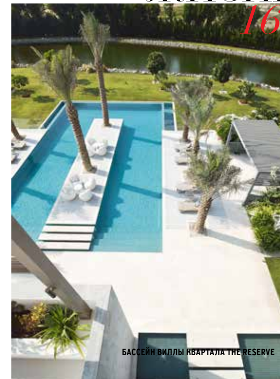
БАССЕЙН ВИЛЛЫ КВАРТАЛА THE RESERVE