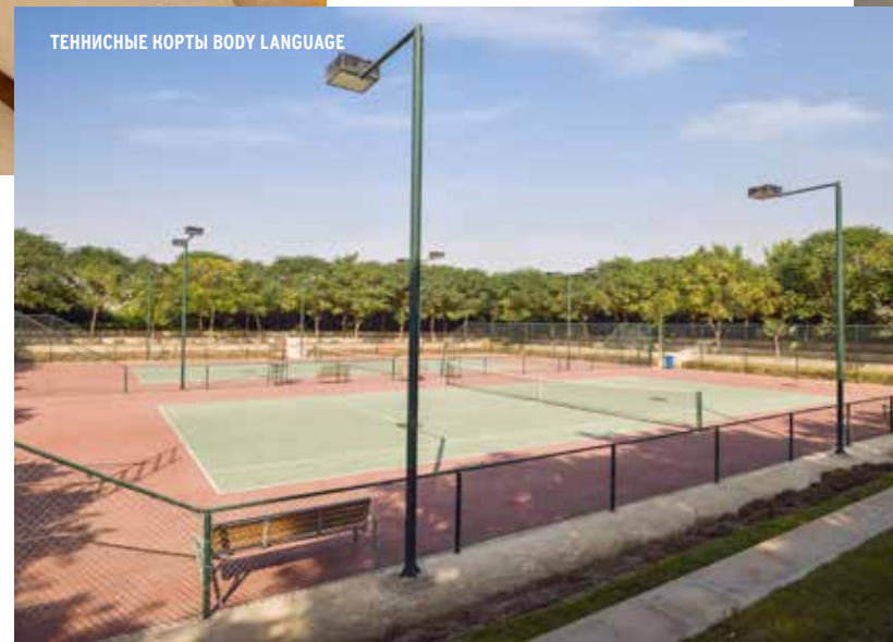
ТЕННИСНЫЕ КОРТЫ BODY LANGUAGE