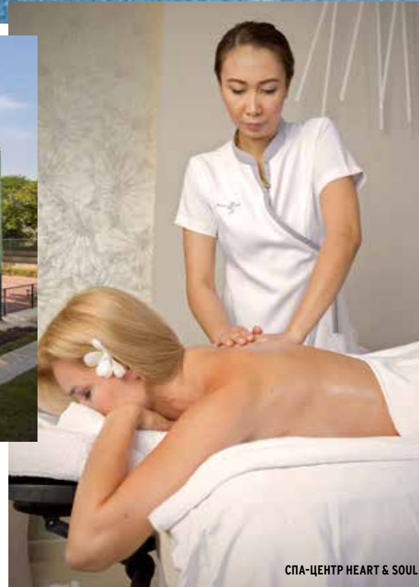
СПА-ЦЕНТР HEART & SOUL