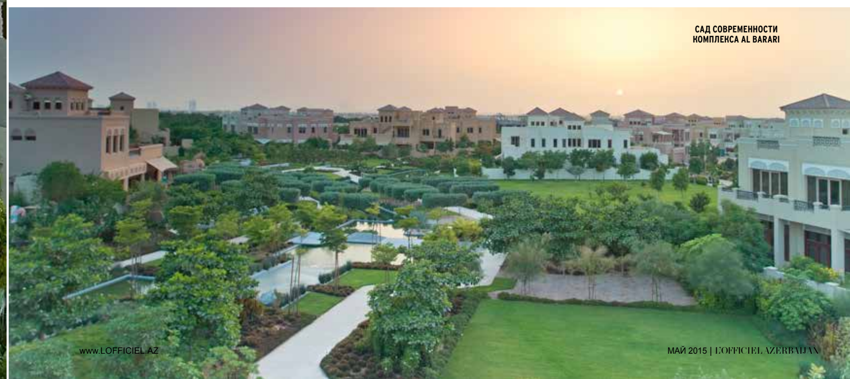
САД СОВРЕМЕННОСТИ КОМПЛЕКСА AL BARARI

На территории комплекса в данный момент расположено 6 тематических садов, общей протяженностью в 16,4 км: Лесной сад, Сад