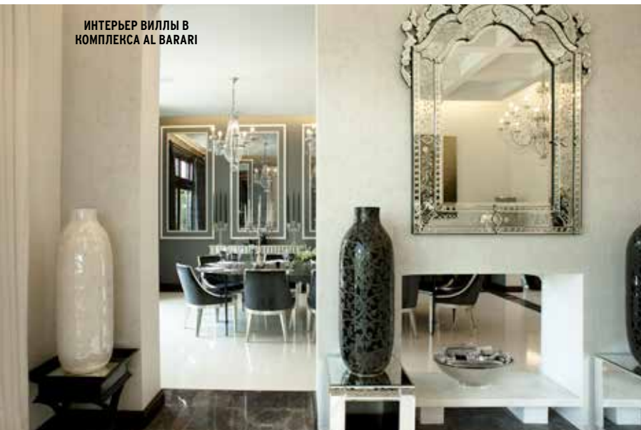
ИНТЕРЬЕР ВИЛЛЫ В КОМПЛЕКСА AL BARARI

Ренессанса, Средиземноморский сад, Балинезийский сад, Сад Современности и Водный сад, в которых произрастает 800 видов редких растений, бережно собранных с разных концов земли. Число садов, украшающих этот комплекс достигнет 34 при второй фазе строительства. Продолжая тему единения с природой, здесь также расположен ресторан органической кухни The Farm, философия которого проста – здоровое питание в непринужденной и спокойной обстановке. Здесь можно насладиться блюдами тайской, средиземноморской, ближневосточной и индийской кухни. Достичь еще большего спокойствия можно в центре красоты Heart&Soul, также расположенном в Al Barari. Опытные терапевты спа-центра рады помочь расслабиться, выровнять баланс души и тела и позаботиться об организме с помощью натуральных природных препаратов. Signature-процедурой в