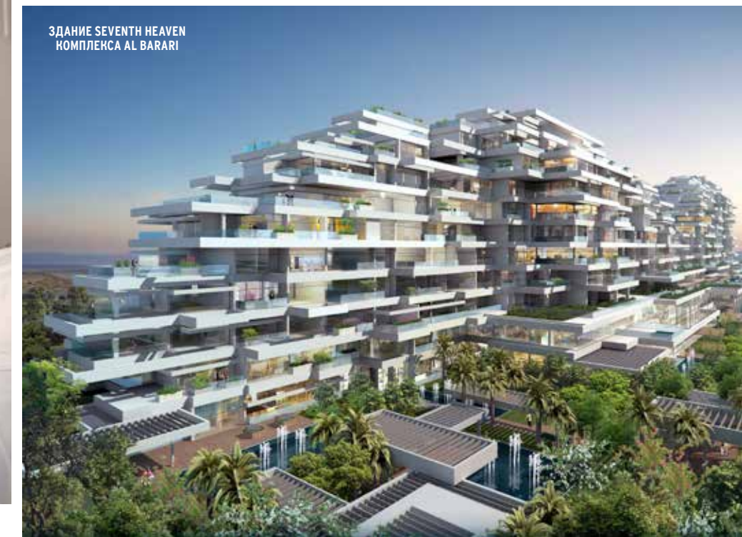
ЗДАНИЕ SEVENTH HEAVEN КОМПЛЕКСА AL BARARI

Heart&Soul является массаж в 6 рук, выполняемый тремя терапевтами. Поддержать себя в тонусе здесь можно, посетив фитнес-клуб Body Language, который состоит из тренажерного зала, инфракрасных парилок, открытого бассейна, двух теннисных кортов и студии, в которой проходят занятия по йоге, зумбе и пилатесу. После возведения вилл создатели комплекса перешли ко второй фазе застройки комплекса Al Barari, в которой главенствующее место