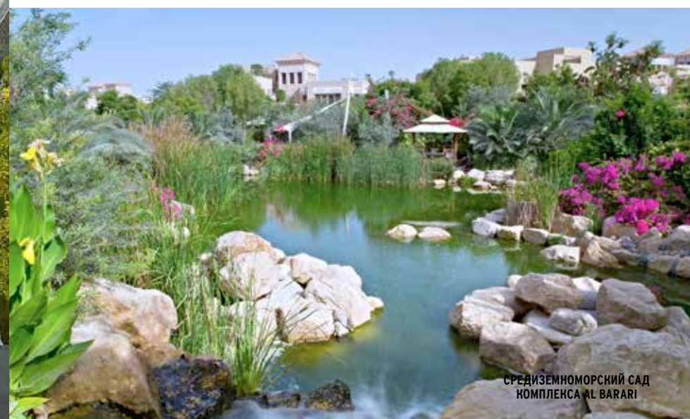
СРЕДИЗЕМНОМОРСКИЙ САД КОМПЛЕКСА AL BARARI

Р асположенный в королевском анклав Дубая Над-эль-Шеба, комплекс Al Barari расположен на территории в 132 гектара, 80% которой занимают зеленые насаждения, которые уютно соседствуют со 189 резиденциями, выполненными в классическом арабском стиле (Акация, Камелия, Бромелия и Далия), и 28 ультрасовременными виллами квартала The Reserve.